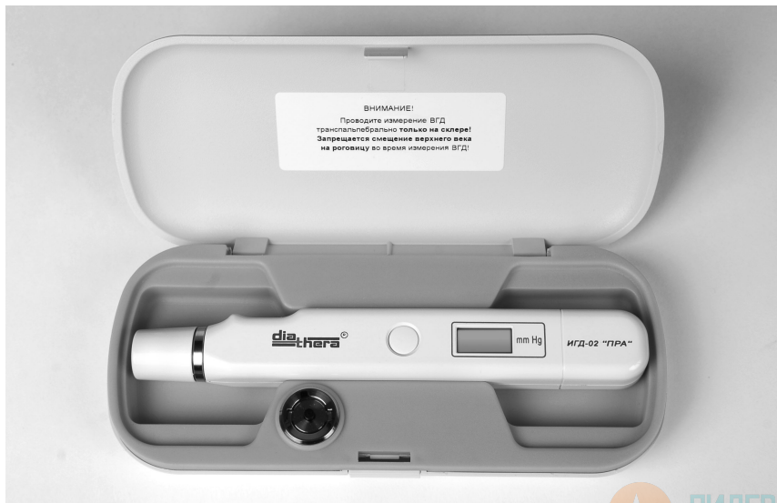
Рисунок 1 — Внешний вид индикатора в футляре

3.2 Внешний вид индикатора представлен на рисунке 1.